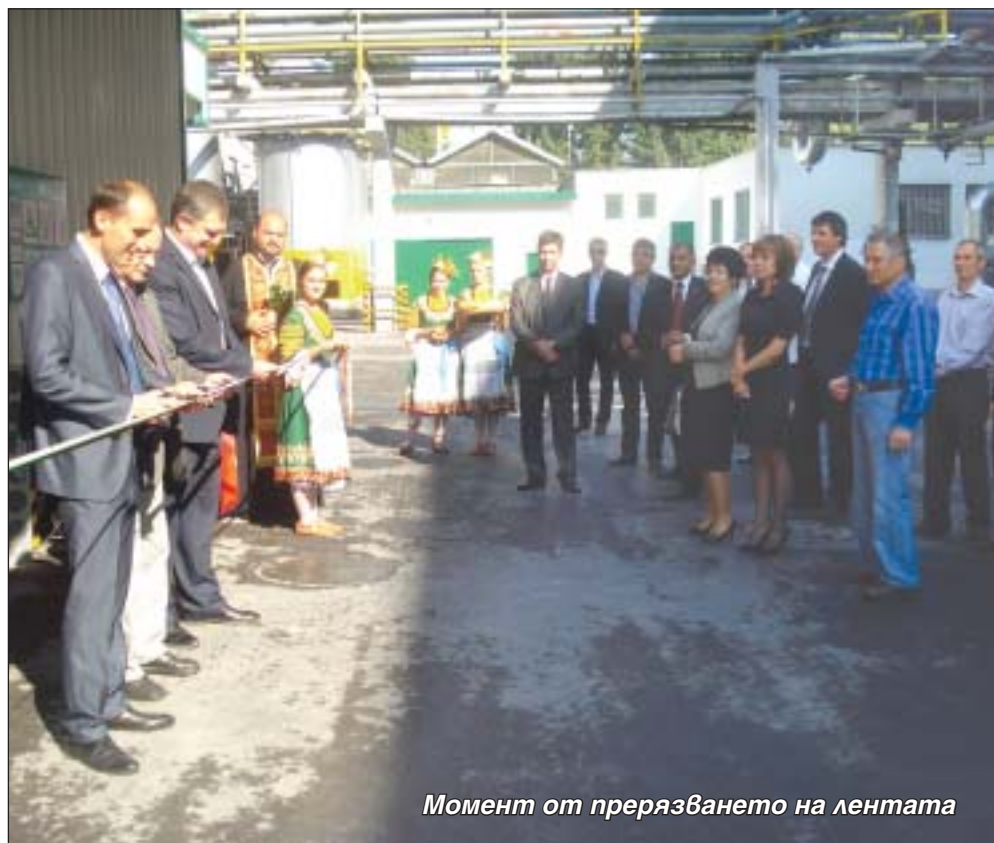
Момент от прерязването на лентата

В новото съоръжение и инфраструктурата към него компанията е инвестирала около 10 млн. лв.