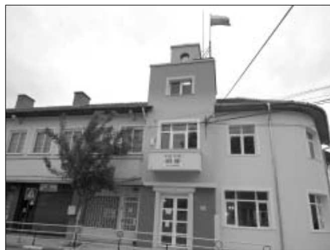
финансира по Проект „Красива България“ с възложител Община Пещера. Средствата, осигурени от МТСП, са 187 000 лв., съфинансирането от страна на Община Пещера е около 130 000 лв.

Ремонтът на съществуващата сграда на читалище „Зора“ се