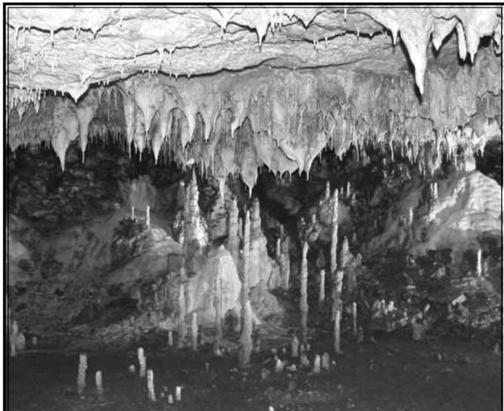
ПЕЩЕРА СНЕЖАНКА РАБОТИ ПРЕЗ ВСИЧКИ СЕЗОНИ НА ГОДИНАТА

Всеки гласоподавател гласува, като върху бюлетината отбелязва със знак „X“ или „V“ избора от него отговор „Да“ или „Не“, поставя бюлетината в плик, пуска плика в избирателната урна и полага подпис в списъка.