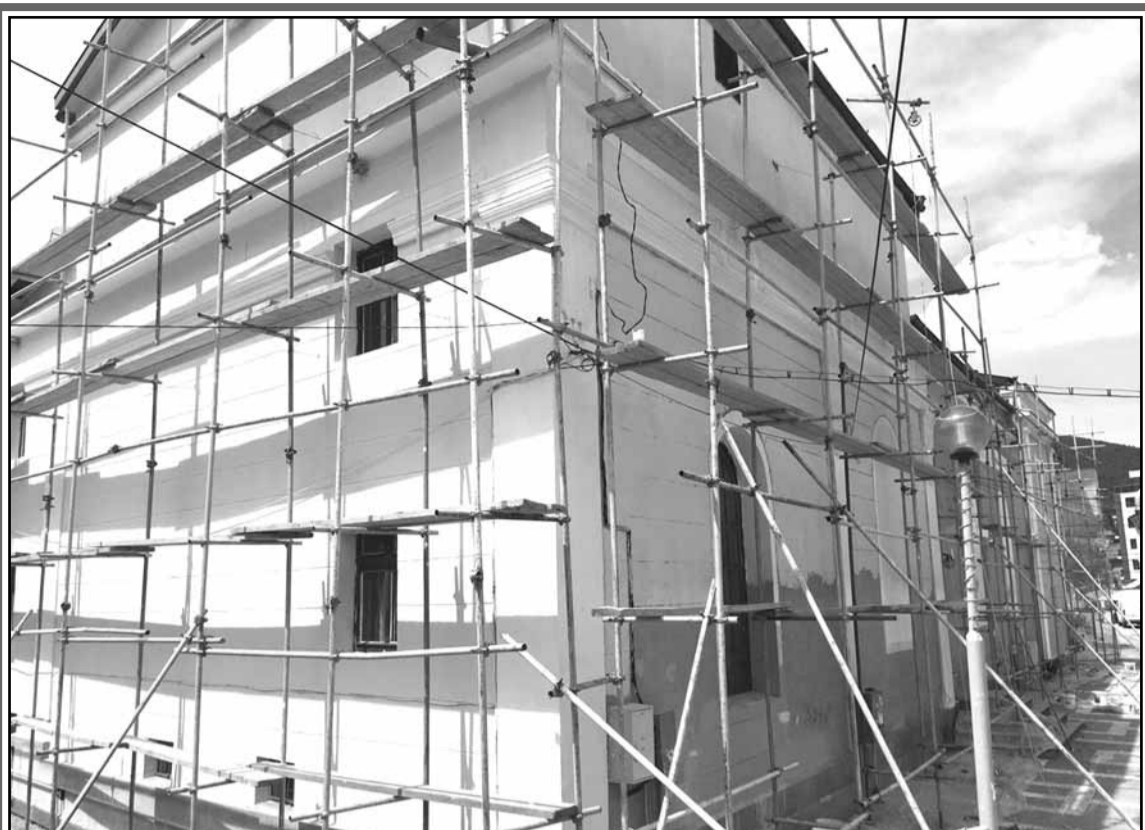
Чаканият дълго време ремонт на фасадата на читалище „Развитие“ започна. За възстановяване и боядисване на външните стени на културната институция Община Пещера отпусна 25 000 лв.

При постъпване на жалба или протест делото е насрочено за 21.04.2016 г. от 10.00 часа.