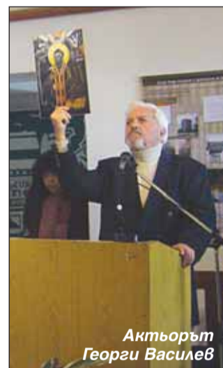
Актьорът Георги Василев

Поздрав към присъстващите отпрати и сек-