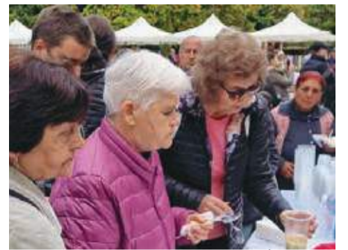
тичните игри с участници от публиката.