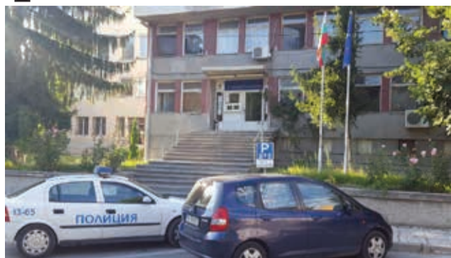
Кражби на имуществен стопанството

За отчетния период се забелязва увеличение на общия брой на регистрираните престъпления по линия „Престъпни посегателства спрямо МПС“, сравнено с предходния период за 2016 г. — 5 бр.; за 2015 г. — 1 бр., увеличение на престъпните посегателства спрямо МПС в процентно отношение е увеличение с 33.33%. Разкрити престъпления: за 2016 г. — 1 бр. /25%/, за 2015 г. — 0 бр. /0%/